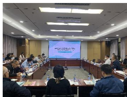
评建工作办公室第1次会议

持续推进校级自评报告撰写。 11月3日，校评建工作办公室发布“对职能部门的工作提示1”，明确自评报告每个指标落实部门、具体到人，组建材料准备组工作群，校评建办统筹协调，加强内外研究。11月8日，校评建工作办公室召开审核评估材料准备组第1次会议，带领自评报告撰写主笔人共同学习新一轮审核评估工作概况、自评报告撰写重点、当前工作进展等。与会人员结合自身任务，进行交流讨论，对所负责的评估指标有了深入理解。11月20日，二级指标牵头部门完成统稿，11月21日，召开材料准备组第2次会议，各二级、一级指标牵头