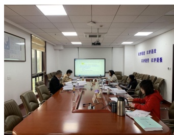
材料准备组第1次会议