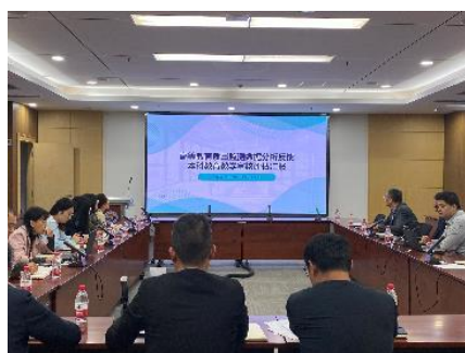
数据填报辅导交流会

完成本科教学状态数据采集。 为进一步做好本科教学状态数据采集工作，10月20日，校评建工作办公室协同质量办，召开审核评估核心状态数据填报辅导交流会，邀请教育教学质量监测与评估专家徐国森，站在审核评估专家的角度，对学校2022年《本科教学状态数据报告》中反映出的问题进行诊断分析，经过专家辅导交流，各数据填报审核人、填报人均对指标内涵有了进一步理解。11月9日，学校召开评建工作办公室第1次会议，集中研究第1稿中的审核评估核心指标，后续将针对不足指标，逐步推进整改落实。